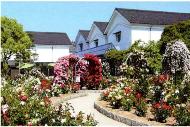
ゲンゼ博物館・バラ園

★3密防止の為、募集人員を60名とさせて頂いております。★出発時間・旅行明細は後日連絡致します。 ★本旅行は、全但バス(株)と受注型企画旅行契約として実施致します。★詳しい旅行条件は別途お渡し致します。