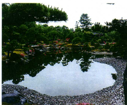
日本庭園・由志園